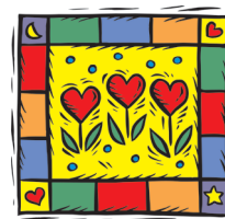
Gemenskap i Kungsör

Tryckta programblad finns på biblioteket och i kommunhuset. Kommande program läggs också fortlöpande ut på Facebooksidan "Gemenskap i Kungsör".